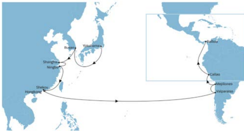
Fig. No 3

En el 2010 habían servicios con barcos neo panamax que desde Asia iban a México luego llegaban a Balboa, iban Chile y después regresaban a Panamá para ir a México y luego a Asia, eso servicios han cambiado y hoy día llegan a México- siguen a Balboa- luego van hasta Chile y desde allí regresan directo a Asia, lo que resta carga de trasbordo a los puertos y al Canal seco de Panamá. Ver Fig. No 4