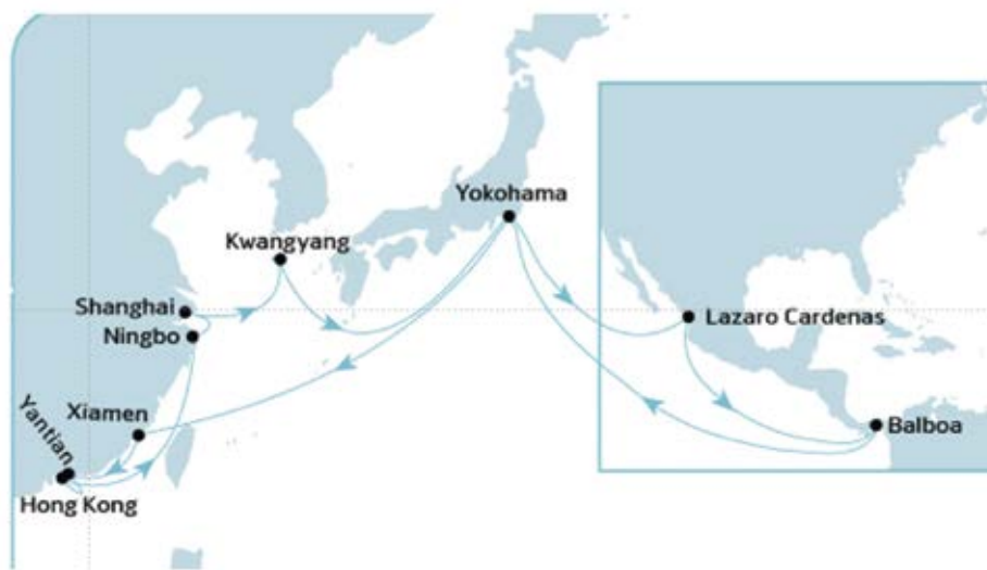
Fig No. 2

- The changes in the routes of the shipping lines.